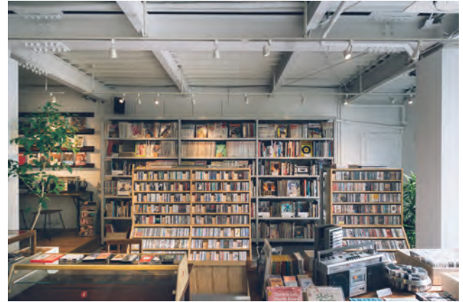
▲BookCafeのように店内に並ぶ雑誌