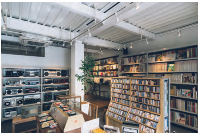
▲店内の奥には視聴ブースが完備されている