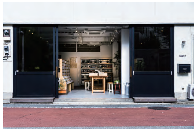
▲シンプルな外観デザイン