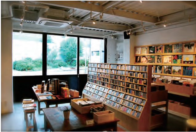
▲大きな窓からは緑が見え、閑静な風景が映り込む

2015年8月12日、中目黒の住宅街にオープンした「waltz」。 レコード、カセットテープ、VHS、そして国内外の雑誌のバックナンバーや書籍を取り揃えた店内では情緒ある光景が撮影できます。